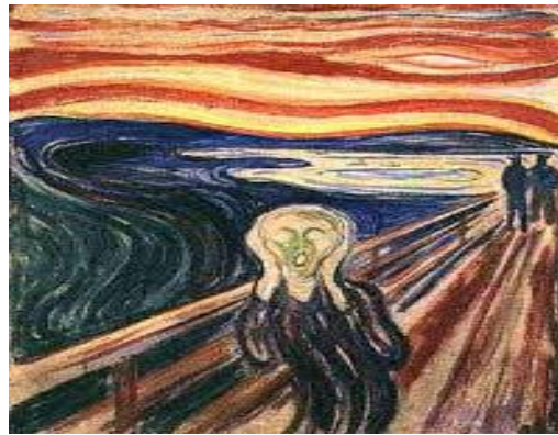
O GRITO (Edward Munch- 1893)