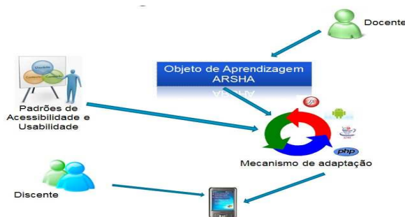
Figura 1. Arquitetura do ARSHA

Nesta seção será apresentado o ARSHA (Arquitetura de Software e Hardware ), de acordo com padrões de usabilidade e acessibilidade acessadas via dispositivos móveis. O objeto de aprendizagem foi desenvolvido conforme os padrões de usabilidade e Acessibilidade, como também integrou a API para PHP TERA-WURFL - Mobile Device Identification que identifica o dispositivo móvel de acesso e permite adaptação das diversas características do mesmo. A Figura 1 ilustra a arquitetura do objeto de aprendizagem proposto. O sistema integra um mecanismo de adaptação a diferentes modelos de dispositivos móveis conforme os padrões de usabilidade e acessibilidade estudados. O discente e o docente poderão acessar o objeto de aprendizagem já adaptado ao seu dispositivo móvel.