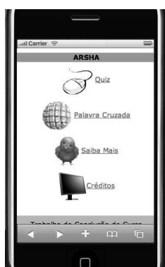
Figura 2. Pagina Inicial

que é um arquivo XML que contém informações sobre as características de diversos dispositivos móveis de todo o mundo. Esse arquivo faz parte de um projeto open source mantido por diversas comunidades, fabricantes e empresas de telefonia de todo o mundo (WURFL, 2004). O ARSHA compõe-se de atividades e matérias de apoio. As Figuras 2, 3 e 4 ilustram respectivamente a tela inicial, opções e atividades implementadas no objeto de aprendizagem. Após acessar o sistema o aluno é direcionado as opções (Figura 2). A opção Saiba Mais apresenta materiais na extensão PDF sobre o tema Gerenciamento de Partições e Sistema de Arquivos, sendo que o usuário poderá efetuar o download do arquivo para visualizar futuramente. Após a leitura do material de apoio o aluno é direcionado a atividades. A Figura 4 ilustra a atividade Quiz, atividade de múltipla composta de por quatro alternativas de resposta. O discente deverá marcar a alternativa correta, após o sistema trará o feedback com a respectiva pontuação.