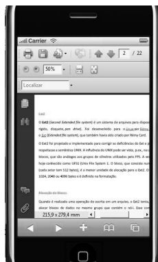
Figura 3. Saiba Mais